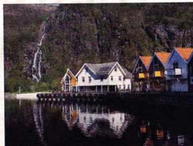
VED FJORDEN: Modalen Sjø og Fritid ligg i enden av Mofjorden. 20 små og store leiligheter kan huse opp mot 80 gjester.