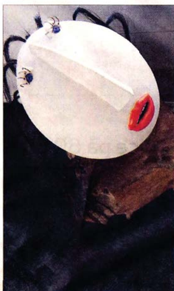
VELKOMEN: Innanfor dørene til Mobryggen Restaurant er det denne dama som tar imot gjestene.