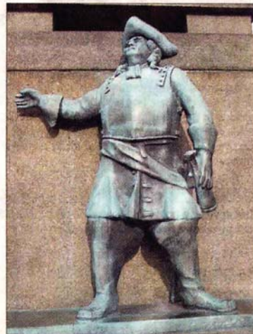
Han her vet du vel kor høyrer heme?