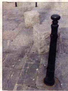
I GÅR: nedre Ole Bulls plass, mot Torgallmenningen